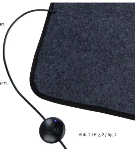
Abb. 2 / Fig. 2 / fig. 2

La LED intégrée à la interrupteur à pied indique l'état de fonctionnement du « Tapis chauffant ». Si la LED est bleue, le « Tapis chauffant » est allumé. Si la LED ne s'allume pas, il est éteint.